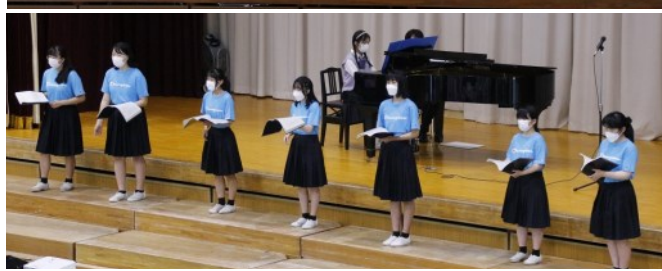
ステージ発表(吹奏楽・演劇・合唱)