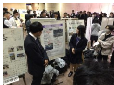
来場者を前に発表する様子