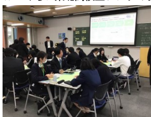
東北各地の高校生と一緒に研究討議し、その後、発表しあいました。