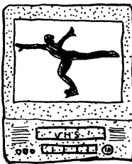
20世紀のテレビデオ